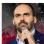
Eduardo Bolsonaro @BolsonaroSP

O apoio do denunciado à manifestação contrária a instituições democráticas brasileiras tem gerado no país uma insegurança em relação à manutenção da ordem democrática. Reforça a apreensão dos brasileiros o fato de pessoas diretamente ligadas ao denunciado, como seu filho, Deputado Federal Eduardo Bolsonaro, também apoiarem a convocação dos movimentos de extrema direita, como revela a seguinte declaração em rede social: