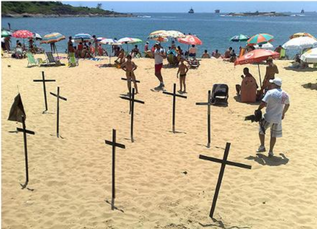
Protesto na Praia da Costa, em Vila Velha, na manhã deste sábado

Moradores de Vila Velha protestaram, mais uma vez, contra a instalação de uma rede elétrica de alta tensão e o despejo do que chamam de "lama tóxica" nas praias do município. Os manifestantes saíram do bairro Praia das Gaivotas por volta das 8h deste sábado (11) e seguiram até o clube Libanês, na orla da Praia da Costa.